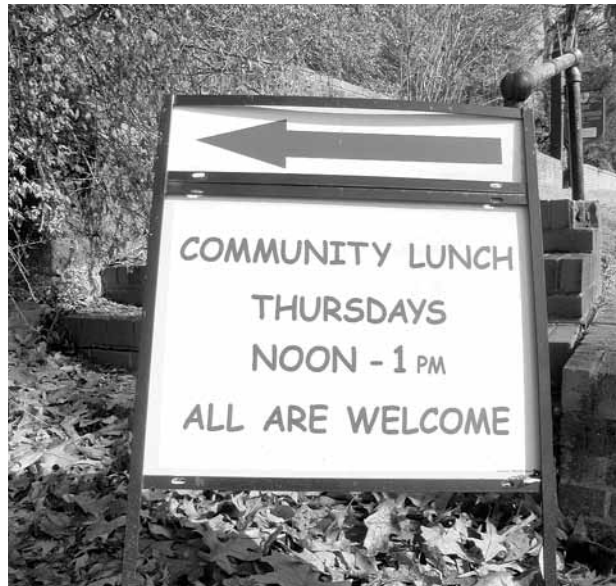
A corner sign invites all Chatham County to the Saint Bartholomew Episcopalian Church’s successful free-for-all ‘Community Lunch.’

For people in tougher economic situations, the county has a few sources of help: CORA Food Bank,