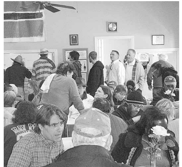
Dentro del comedor de la Iglesia Episcopal de Pittsboro, San Bart, la amistad y la comida nunca faltan los jueves al mediodía.

Aunque la Iglesia Episcopal de San Bart ofrece un almuerzo gratuito los jueves al mediodía, su objetivo no es aliviar la pobreza económica sino fomentar el acercamiento de la comunidad. El almuerzo, es atendido por gentes con toda suerte de ocupaciones quienes