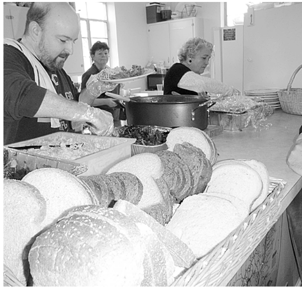
Cada mediodía de jueves los voluntarios de la Iglesia de San Bart viven su fe sirviendo a la comunidad.

El Vínculo, Santa Julia y Cora ofrecen, entre otras cosas, despensas a familias necesitadas. Migrantes, anglo- y afroamericanas. El vínculo asiste la cocina de